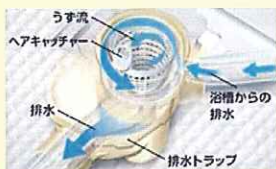
『くるりんポイ排水口』

○メーカー希望小売価格： 749,000円～1,600,000円 【税込：786,450円～1,680,000円】 ※取付費別途