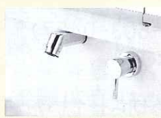
『ハイバックガードカウンター』

○メーカー希望小売価格： 間口750mm・三面鏡 バックポケット付片引き出しタイプ 223,000円から ※取付費別途