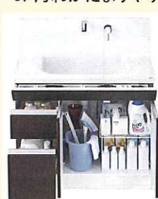
『奥ひろ収納とバックポケット』