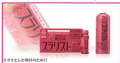
スラリとした明日のために

皮下脂肪キラー 脂肪を分解・燃焼して、 体脂肪を減らす ¥3,675- (税込) 10本入