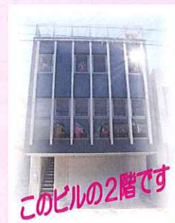
このビルの2階です