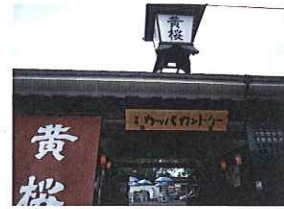
黄桜カップカントリー

今回改装させていただき きたせ昆布様。 納屋町商店街にあります。 昆布の香りがそそられます。