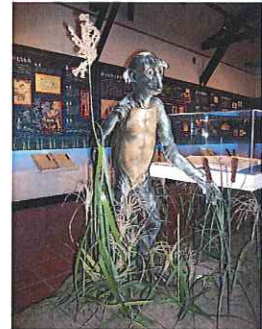
リアルなカップちゃん 平面なのに立体的