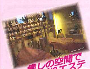
癒しの空間で のんびりエステ